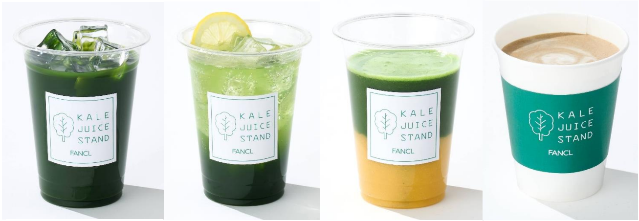
ケール青汁ストレート